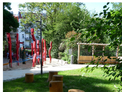
Der "Hexenwald" als Spielfläche für die Grundschüler