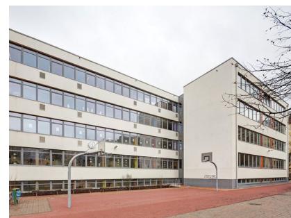
Die hofseitige Fassade nach der Sanierung