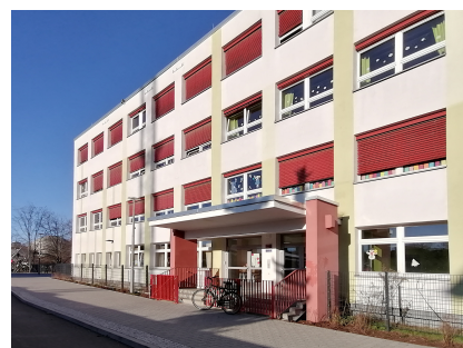
Die Grundschule am Planetarium mit neuer Fassadengestaltung