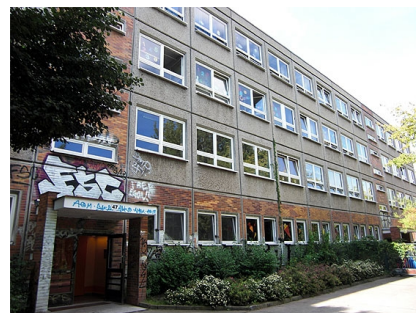
Die Schule vor der Sanierung