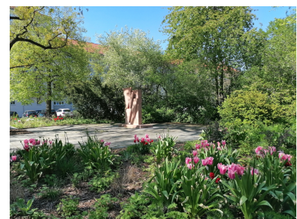
Der Platz um das Mahnmal wurde aufgewertet