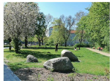
Ein grüner Ort für Entspannung, Spiel und Sport