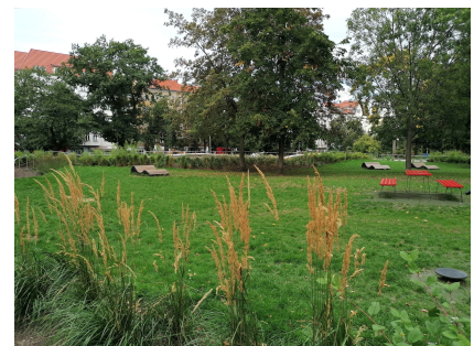
Der Fröbelplatz ist zum attraktiven Treffpunkt geworden