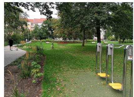
Sportgeräte, Sonnenliegen und Picknickplätze für die Nachbarschaft