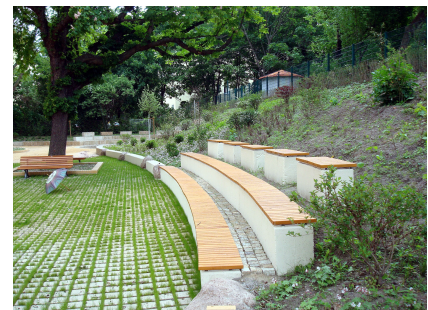
Sitzstufen für entspannte Pausen