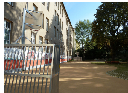
Das Ballspielfeld nimmt den größten Teil des Schulhofs ein