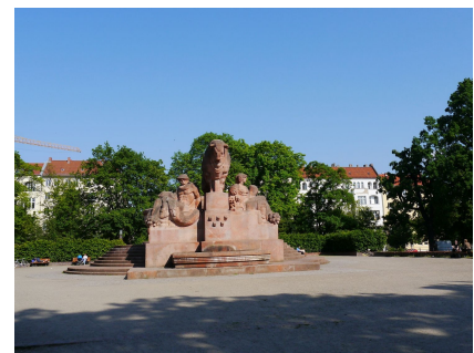
Das Plateau mit dem "Stierbrunnen"