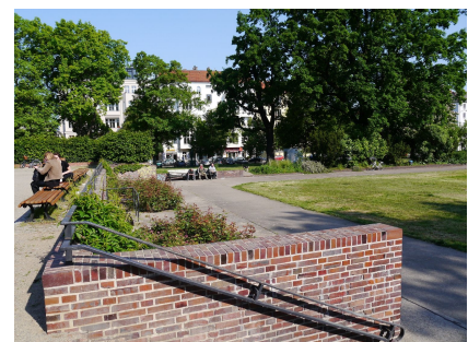
Die Bepflanzung wurde denkmalgerecht erneuert