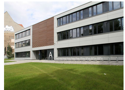
Der Modulare Ergänzungsbau an der Corinthstraße