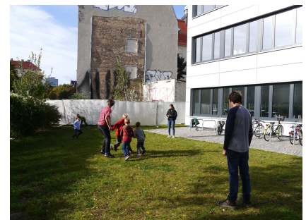
Der Erweiterungsbau soll mit dem Südflügel der Lasker-Schule verbunden werden