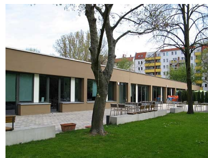
Die eingeschossige Gartenseite mit der Terrasse des Begegnungszentrums