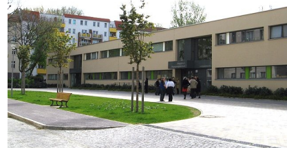
Der Vorplatz mit den beiden Eingängen zur Schule und zum Begegnungszentrum