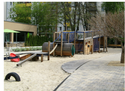
Besondere Spielgeräte auf den Schulfreiflächen