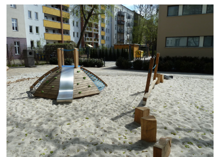
Auch der öffentliche Spielplatz vor dem Haus wurde erneuert