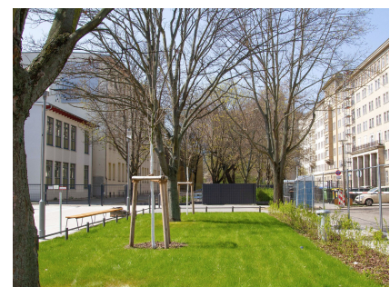
Blick in Richtung Händelgymnasium und Wohnbebauung der 1950er-Jahre