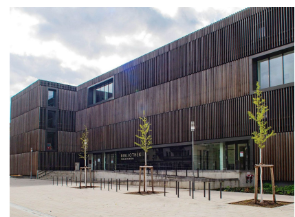
Der neu gestaltete Vorplatz der Zentralen Bezirksbibliothek