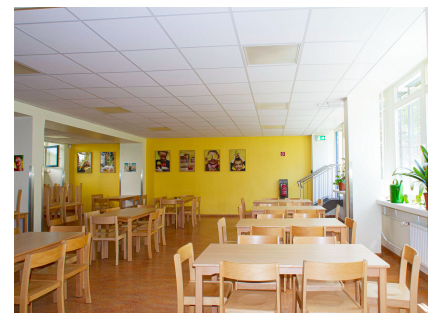
Freundliche Farben schaffen Atmosphäre