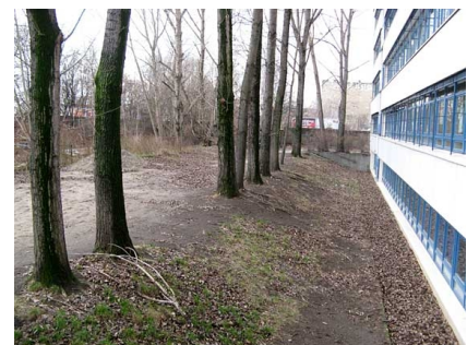
Zustand vor der Neugestaltung