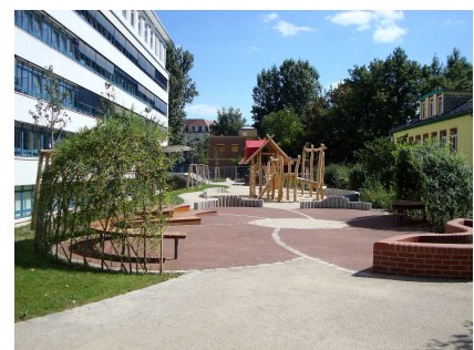
Der Schulhof mit dem Blumenmotiv