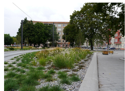
Nach dem Umbau: Städtische Oase inspiriert von finnischer Landschaft