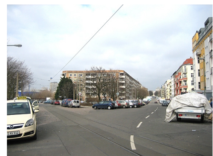
Der Platz vor der Neugestaltung