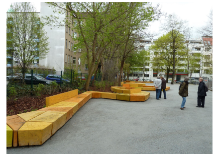
Bühne und Ruherraum zwischen Kadiner und Lasdehner Straße