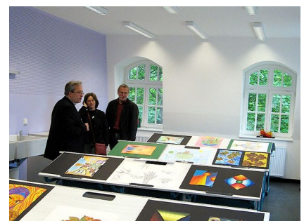
Der Zeichensaal im Obergeschoss bietet optimale Bedingungen