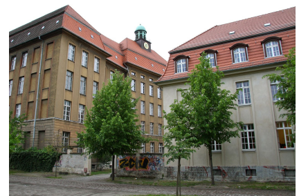
Das Inspektorenhaus (rechts) neben dem noch unsanierten Hauptgebäude