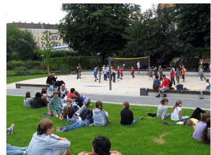
Das neue Beachballfeld und die Liegewiese