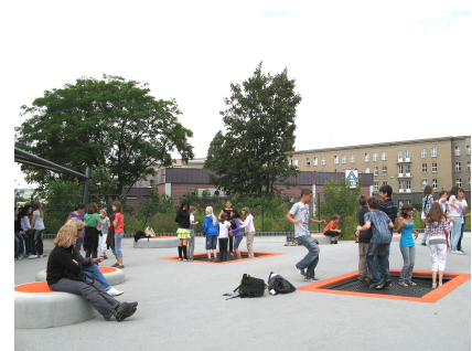
Trampoline sind bei allen beliebt