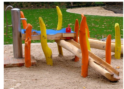
Auf dem Wasserspielplatz