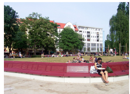
Auf der langen Bank ist Zeit für Muße