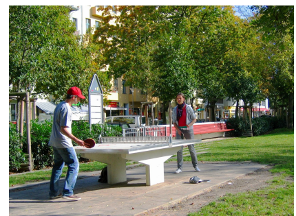
Auch die Erwachsenen können aktiv sein