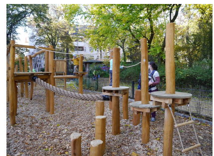
Kletter- und Balancierparcours auf der Erweiterungsfläche