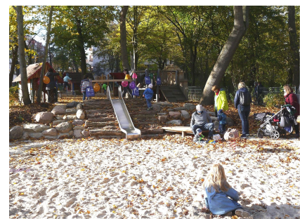
Die große Sandfläche mit Hangrutsche