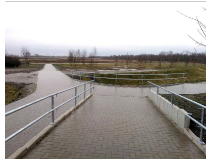
Abfanggitter am Hechtgraben. Im Hintergrund die Parkbandtangente im Landschaftspark