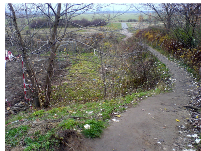
Der Übergang über den Hechtgraben vor Projektbeginn