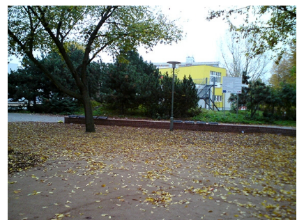
Herbststimmung am erneuerten Stadtplatz