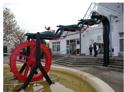
Die Brunnenkunstwerk wurde überarbeitet