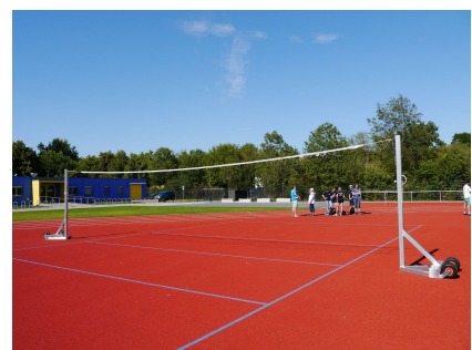
Auch Volleyball und Beachvolleyball sind möglich