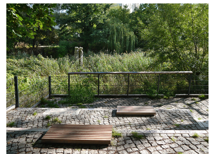
Terrasse mit Blick auf den Teich