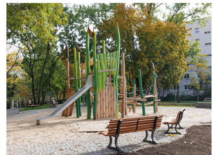
Der neue Spielplatz am Krummen Pfuhl