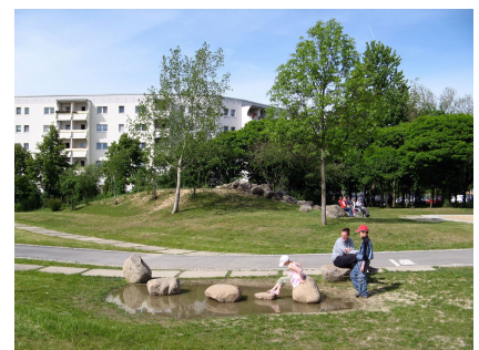
Auch an Rückzugsbereiche ist gedacht