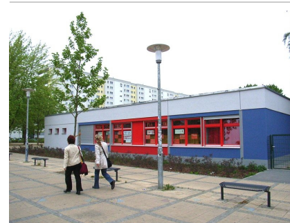
Das Mädchensportzentrum 2008 nach der Fassadensanierung

2006 bis 2008 (Fassade u. Freiflächen) sowie 2015 (Dach)