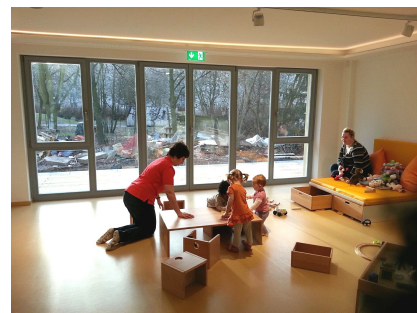
Seit 4. Januar 2016 ist die KunstKita ARTKI in Betrieb