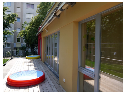
An der Gartenseite verläuft eine Sonnenterrasse