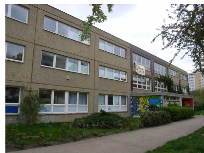
Das Gebäude vor der energetischen Sanierung