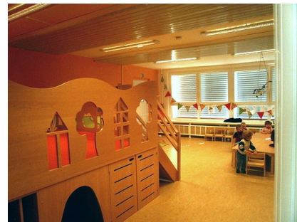
Im Krugwiesenhof gibt es auch eine Kita

Kita: 2011 bis 2012 Umbau und energetische Sanierung: 2004 bis 2008