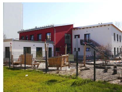
Der dreigliedrige Neubau von der Gartenseite