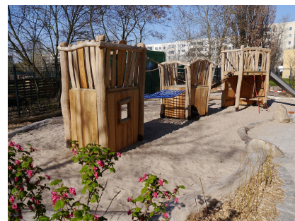
Die Freifläche mit vielen Angeboten für spielerische Bewegung