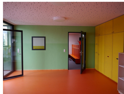
Viel Licht und kräftige Farben in den Innenräumen