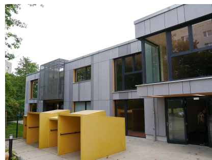
Der Eingang der neuen Kita "Kieke mal"