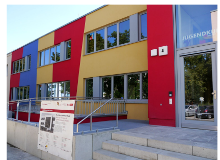
Die Jugendkunstschule wurde innen und außen umgebaut und saniert