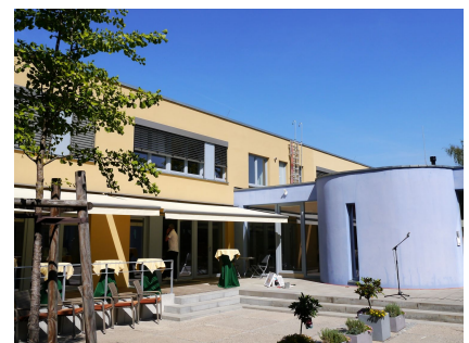
Die neue Caféterrace und der Übergang zur KunstKita ArtKi