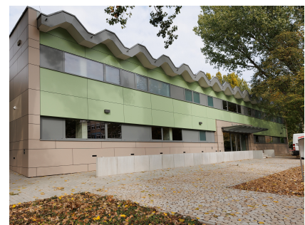
Die sanierte Typen-Sporthalle