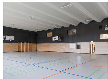
Die Halle mit schallabsorbierenden Wänden, neuem Boden und Fenstern zum Funktionstrakt