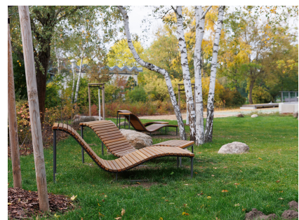
Ein Ort zum Entspannen im Birkenhain