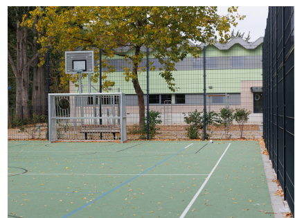
Einer von mehreren neuen Ballspielplätzen