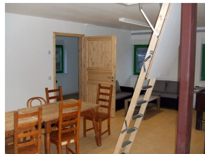
Gemütliche Räume für Spiel und Kreatives bei schlechtem Wetter, Lagerraum auf dem Dachboden