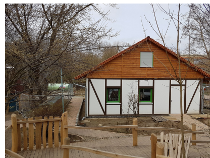
Das neue Spielhaus auf dem Abenteuerspielplatz