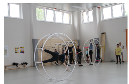
Ideale Trainingsbedingungen für angehende Zirkusartist*innen