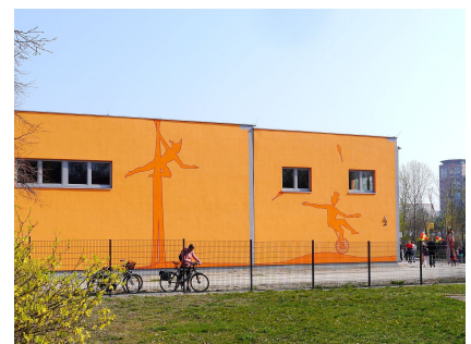
Die orange leuchtende Fassade schmücken Zirkusmotive