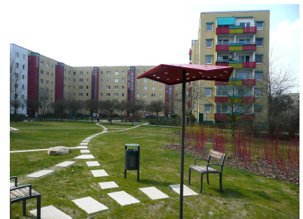
Sitzplatz in der Louis-Lewin-Straße