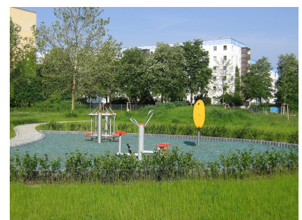
Kleine Fitnessfläche in der John-Heartfield-Straße