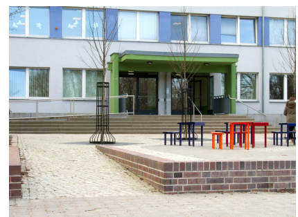
Breite Rampen und Sitzmauern auf dem terrassierten Schulhof