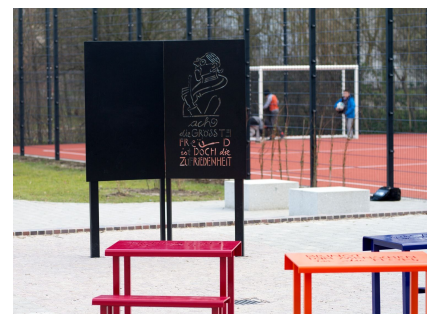
Das Klassenzimmer im Freien mit der Busch-Figur Lehrer Lempel auf der Tafel