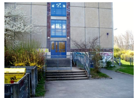
Hier wurde der neue Gebäudeteil angefügt