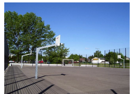
Das Sport-Aktionsfeld wurde verlagert und neu gestaltet