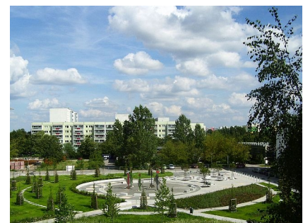
Um den befestigten Platz ist ein grünes Areal mit vielen jungen Bäumen entstanden