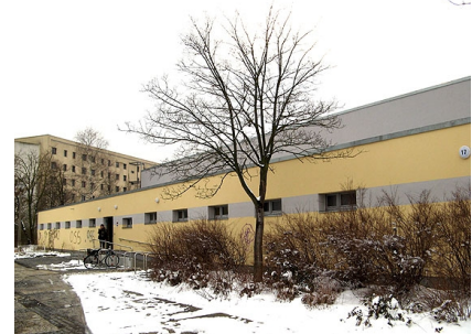
Die Fassade nach der Sanierung im März 2013