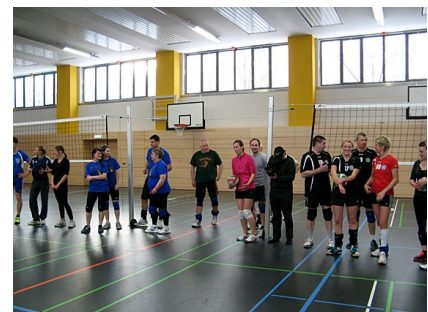
Hell und modern - die sanierte Halle zur Eröffnung