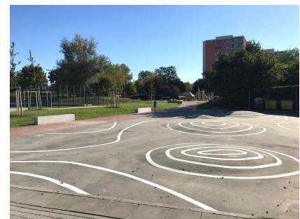
Die neue Fläche für große und kleine Rollsportler*innen