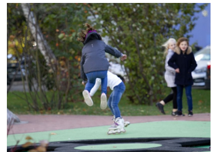
Die Kids haben Spaß auf den verschiedenen Sport- und Spielflächen