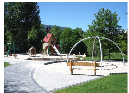
Blick auf den Spielplatz am Baltenring