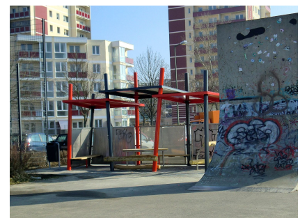
Der neue Jugendtreffpunkt an der Skaterfläche