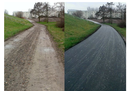
Die zukünftige Rollsportstrecke wurde asphaltiert