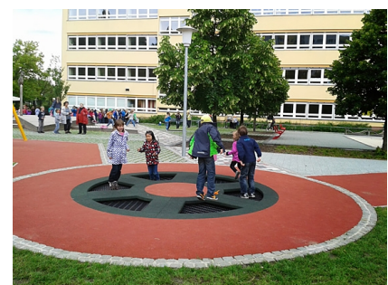
Das Trampolin macht Spaß und schult die Motorik