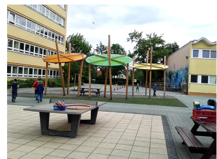
Die Fruchtschirmchen als Schattenspender geben dem Schulhof ein markantes Gesicht