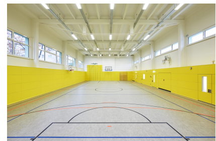
Der Innenraum ist überwiegend in Gelb gehalten