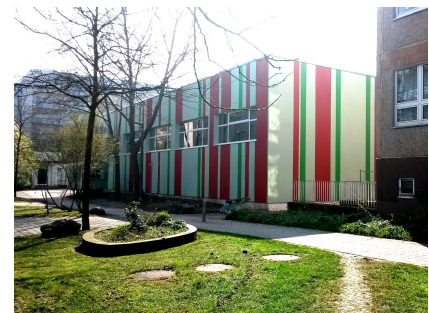
Die sanierte Sporthalle mit der markanten Fassade