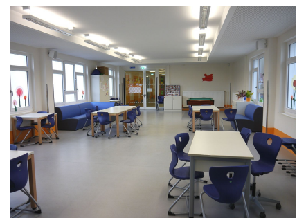
Im Verbinder wurde Platz für zusätzliche Horträume geschaffen