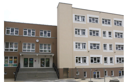
Die Pusteblume-Grundschule mit dem aufgestockten Verbinder