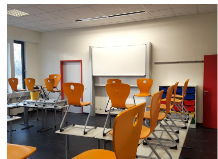
Die Klassenräume in der 2. und 3. Etage sind mit digitalen Tafeln ausgestattet