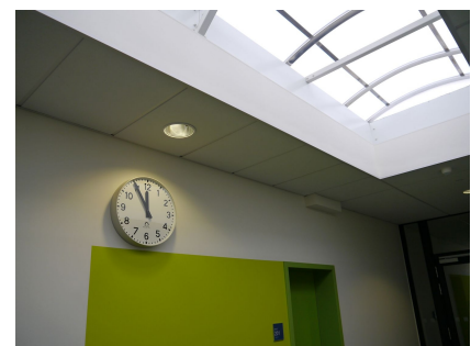
Der Flur der oberen Etage wird über Oberlichter natürlich beleuchtet