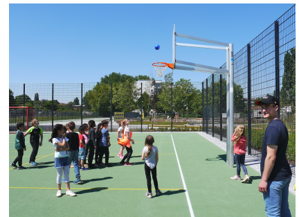
Der große Ballspielplatz mit zwei Fußballtoren und vier Basketballkörben