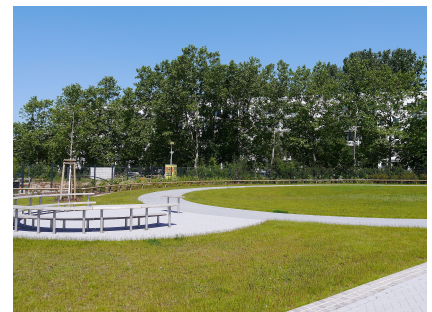
Neben dem Pavillon steht ein weiteres grünes Klassenzimmer zur Verfügung