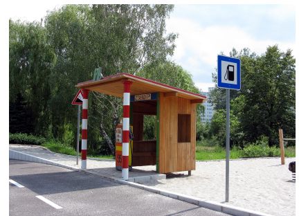
Der Verkehrsgarten entstand 2010 auf der Rückbaufläche eines Kindergartens