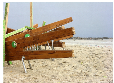
Eine Krokodilherde auf dem erneuerten Hortspielfeld

Stand: August 2012