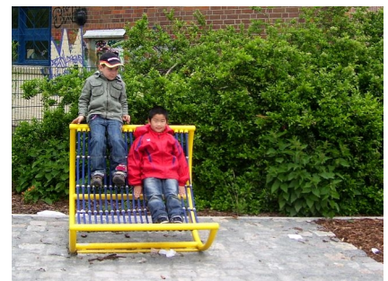
Die Fläche um das Mehrzweckgebäude wurde 2009 neu gestaltet