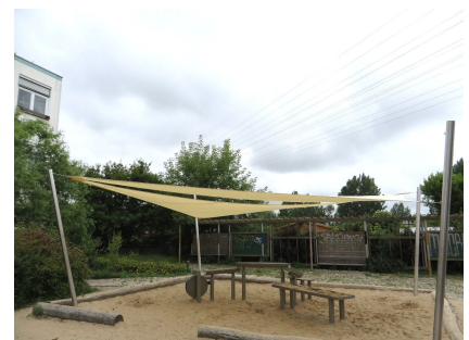
2014 erhielt der 2010 entstandene Wasserspielplatz ein Sonnensegel